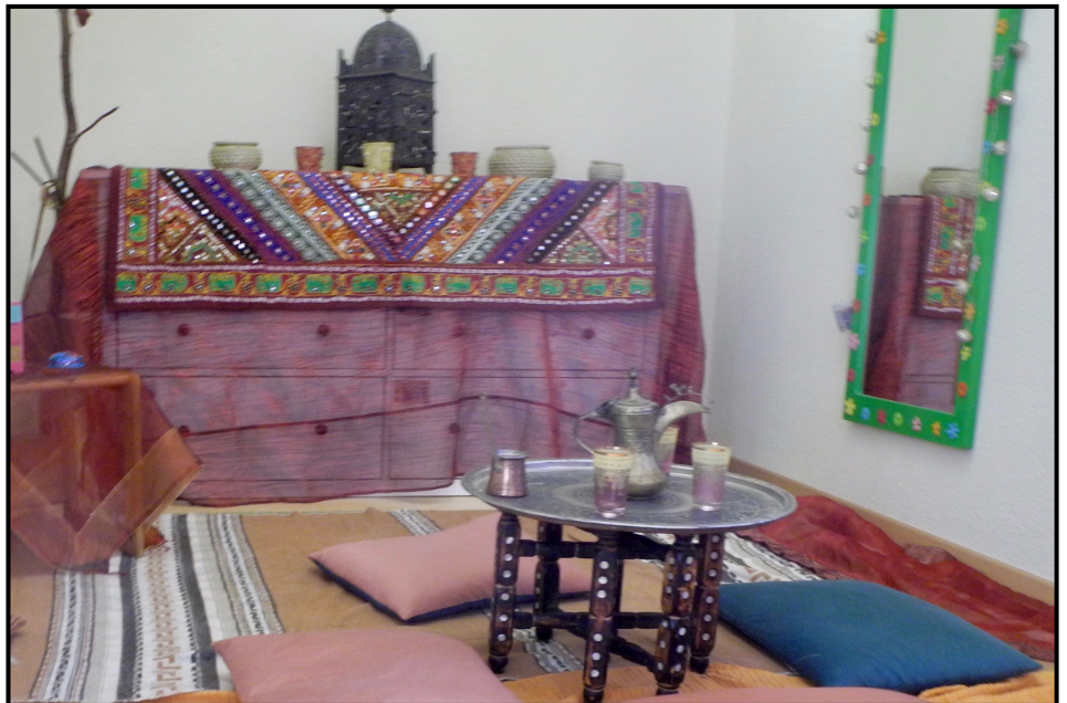
Im Wohnzimmer sitzt man auf Kissen am Boden. Der Besucher wird immer zu einem Glas Tee eingeladen.