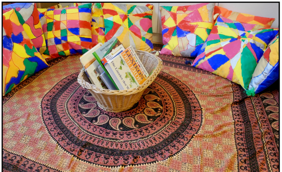
Salam aleikum - Aleikum salam!