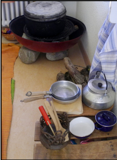
Unsere Küche. Gekocht wird auf dem Feuer