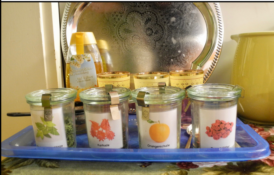
Unser Haustee wird aus marokkanischer Minze, Karkade, Rosenblätter und Orangenschale gekocht. Er wird am Schluss mit Honig gesüßt.